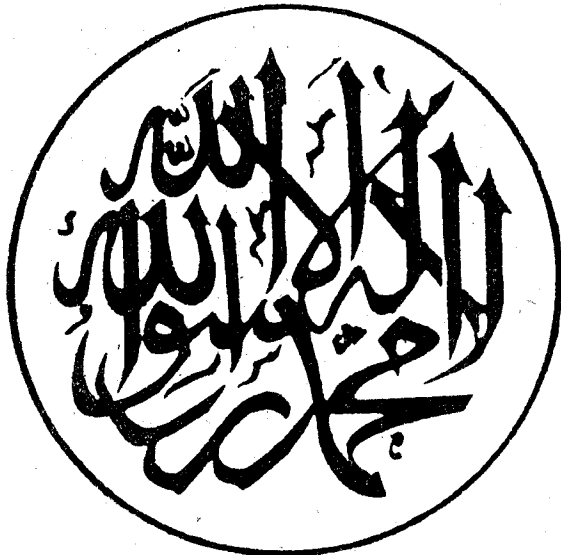
Das Siegel des Propheten

Sein späterer Wohlstand hatte ihn die Vergangenheit nicht vergessen lassen. Der herbe Verlust gerade der beiden Söhne und sein inneres Suchen verinnerlichte ihn mehr und mehr. Das Warum? ließ ihn nicht mehr los. Mit etwa 40 Jahren, er ist um 570 geboren in Mekka und am 8. Juni 632 in Medina verstorben, hatte er die erste Vision. Er fühlte sich göttlich inspiriert. In der 96. Sure (Abschnitt) des Korans ist diese seine erste Offenbarung festgehalten. Ihr folgten weitere und immer weitere. Sie wurden später — obwohl er auch